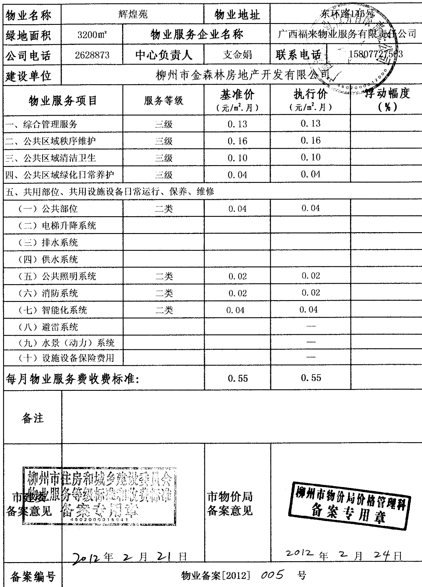
柳州市物业服务等级标准和收费标准备案表